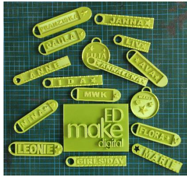
Abbildung 1: 3D-gedruckte Schlüsselanhänger nach Entwürfen der Teilnehmerinnen (Stuttgart 2021, Foto: Maria Barnhart, Universität Stuttgart 2021)

Vorbilder? Die Erarbeitung der Fragen zielte auf eine Entstigmatisierung des Begriffs Nerd vom partiell negativ behafteten Klischee „männlich, seltsam, sozial isoliert, Streber“ 4 hin zu einem offenen, begeisterten, wertschätzenden gemeinsamen Umgang mit Technik und Fachinteressen jeglicher Art – eine Zielperspektive, die auf die Grundidee des Makings hinweist.