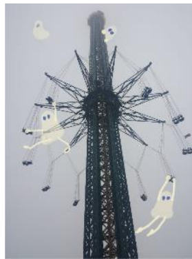
Abbildung 4: Digitale Zeichnung der Kunststudentin Zola Brandau mit ProCreate (Stuttgart 2021, Foto: Zola Brandau, FabLab der ABK Stuttgart 2021)