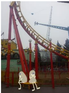
Abbildung 3: Digitale Zeichnung der Kunststudentin Zola Brandau mit ProCreate (Stuttgart 2021, Foto: Zola Brandau, FabLab der ABK Stuttgart 2021)

und ohne besondere räumliche Voraussetzungen kann so mit einem vertrauten Medium gearbeitet werden: Mit dem Apple-Pencil und einer Zeichen- oder Mal-App, wie ProCreate , lässt sich ortsungebunden zeichnen und malen und selbst das Sprühen im Graffiti-Style ist auf dem Tablet geruchs- und klecksfrei umsetzbar. Weitere Beispiele wären Stop-Motion-Filme, digitale Bildbearbeitung, Fotos und Videos mit Greenscreen, die sich ebenso leicht als kreative Making-Projekte im digitalen Raum realisieren lassen. Mit Ausnahme dieser ausschließlich digitalen Arbeiten nutzen die kreativen Studierenden im FabLab sowohl analoge als auch digitale Techniken und Materialien. Um den Lehramtsstudierenden der Bildenden Kunst die Maschinen aus dem FabLab auch in Zeiten von Kontaktbeschränkungen zugänglich zu machen, wurde das FabLab der ABK kurzerhand zum mobilen FabLab umgewandelt und das Homeoffice einzelner FabLab-Mitarbeiter*innen um einen Laser-Cutter und Schneideplotter ergänzt. Folgendes Szenario wurde etabliert: Die Studierenden schickten vor dem Seminar ihre digitalen Daten per eMail, die dann während der Sitzung live gedruckt wurden. Die gecutteten Ergebnisse erhielten die Studierenden per Post zurück. Der fehlende Zugang zum physischen Raum des FabLabs konnte auf diese Weise zum Teil ersetzt werden. Mit den damit wieder lokal verfügbaren physischen Gegenständen wurde in der darauffolgenden Woche im digitalen Raum gemeinsam weitergearbeitet.